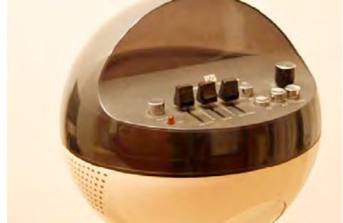
Dorit Margreiter EXQUISITE FUNCTION, 2007 Videostill